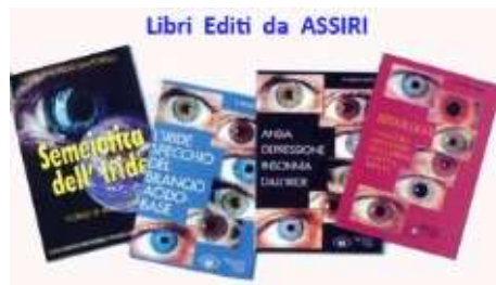
Libri Editi da ASSIRI