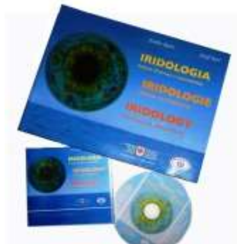
ATLANTE ILLUSTRATO di IRIDOLOGIA + CD