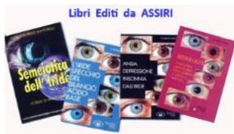
Libri Editi da ASSIRI