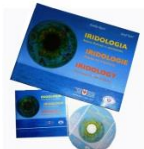
ATLANTE ILLUSTRATO di IRIDOLOGIA + CD