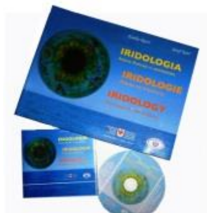
ATLANTE ILLUSTRATO di IRIDOLOGIA + CD